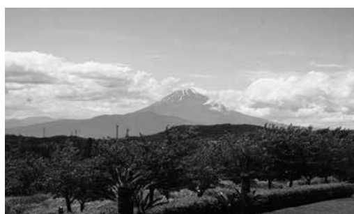
(中伊豆ワイナリーヒルズから望む富士)

中伊豆ワイナリーヒルズでは、ワイナリーの見学、ワインの試飲、富士山を望みながらのバーベキュー、馬場に併設された厩舎内の見学などを楽しみました。