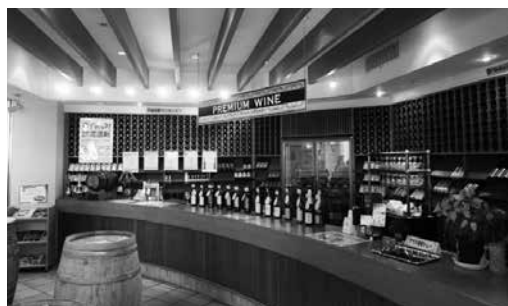
(中伊豆ワイナリーヒルズ)

観光には21名の先生が参加されました。当初は、城ヶ崎海岸および大室山での散策、中伊豆ワイナリーでの昼食／見学を予定していました。しかし、行く手を阻む容赦ない強風が吹き荒れており、大室山のリフトが運行停止となっていたため、道の駅・伊東マリンタウンから中伊豆ワイナリーを巡るコースに急遽変更しました。