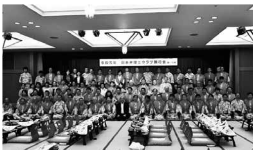
(開宴前の集合写真)

意見交換会の後は懇親会です。大宴会場へと場所を移し、舞台に並んで集合写真を撮影した後、18時30分に開宴となりました。