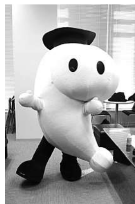
平成12年に誕生した弁理士会のキャラクター「はっぴょん」は、平成26年にその着ぐるみが完成し、各地で活躍しています。

第1事業部は、イベントを活用した広報、紙媒体を利用した広報、例えば、新聞、雑誌への広告掲載、ノベルティグッズの企画・選定・作成、着ぐるみ(写真をご参照ください)の普及と貸出等を行う事業部です。