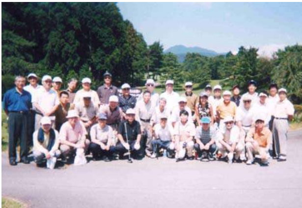
スタート前の記念撮影

今年は、総勢38名の参加を得て盛大に行うことができました。例年よりもスタート時間が遅かったことや、会場が旅館からほど近い場所であったことなどもあり、前日遅くまで夜更かしをされた先生方も多かったようです。