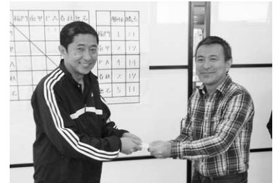
南甲弁理士クラブ