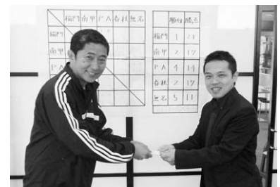
稲門弁理士クラブ